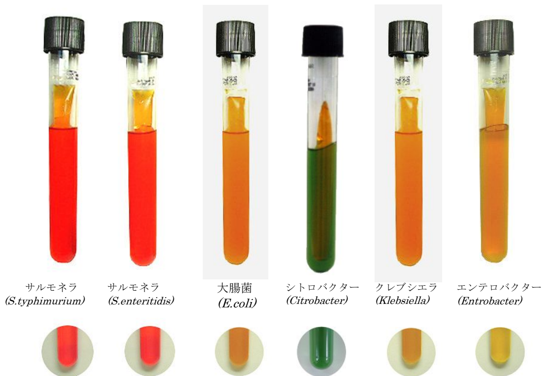
サルモネラ ( S.typhimurium )

培養液が黄色でも 20 時間程度経過後にセンサーが黄色透明に反応する場合、サルモネラが検出されたものとして、確定試験を実施してください。培養液の色は、他の菌による汚染が低い場合でサルモネラが検出された時にオレンジ色になります。